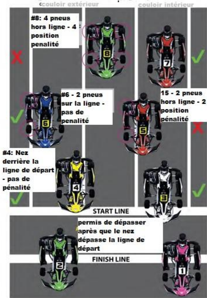
Diagramme 1 - couloir avec lignes peintes